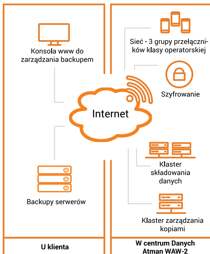
Schemat Backup as a Service

Atman Backup służy klientom do tworzenia kopii zapasowych danych. Naszą usługę wyróżniają trzy kluczowe elementy: